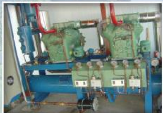
The Compressor complete